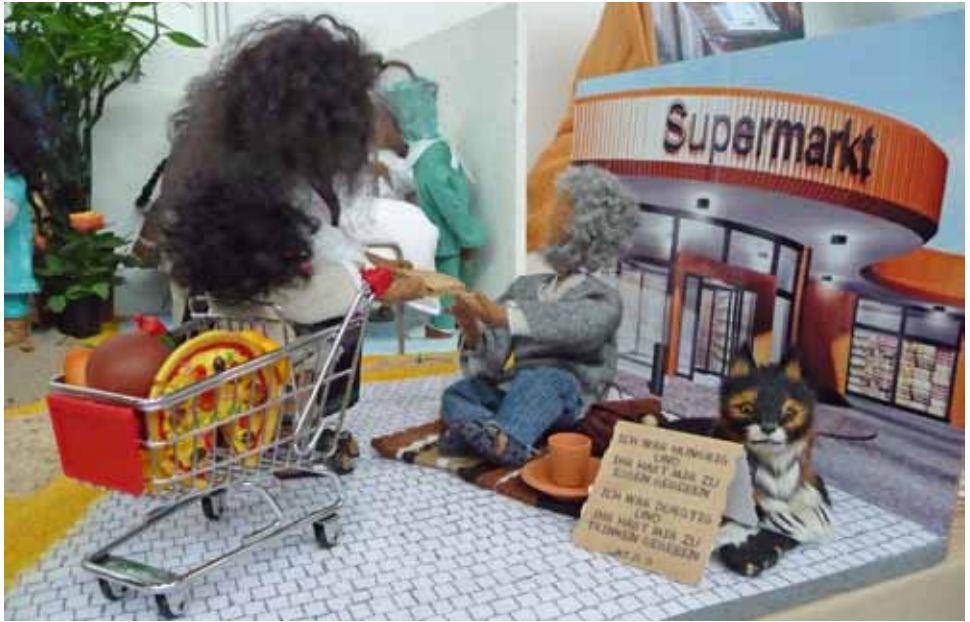
Diese und die vorige Seite: Werke der Barmherzigkeit aus Matthäus 25,31-46