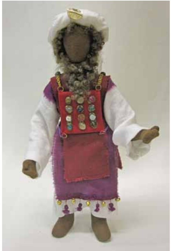
Der Hohe Priester nach unserem Entwurf

Darüber wiederum legt der Hohe Priester den Efod an. Immer noch Zeichen des priesterlichen Amtes, nun aber zu einer Art Schürze umgestaltet. Darauf befestigt ist der Choschen mit den zwölf Edelsteinen, die die Namen der zwölf Stämme Israels tragen. Er hängt an goldenen Kettchen an zwei Steinen auf der Schulter des Efod, die ebenfalls mit den zwölf Stämmen beschriftet sind. Unten wird er mit zwei Purpurschnüren gehalten. Der Choschen ist eine seitlich offene Tasche in der - je nach Interpretation - die Lossteine Urim und Tummim liegen sollen, die allerdings ihre Bedeutung verloren haben und manchmal auch in den beiden Schultersteinen gesehen werden. Die Kopfbedeckung ist aus weißem Byssus (feines Leinen oder Muschelseide) und turbanförmig. genaues ist nicht über-