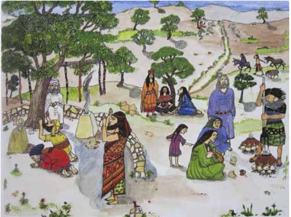
Rekonstruktionszeichnung eines Kultplatzes: die Kultstätte um einen besonderen Baum ist mit einer niedrigen Mauer umgeben. Besucher haben geopfert und bereiten die geschlachteten Tiere zum Essen.

sehr direkt, wird aber meist nur vom Sippenältesten in besonderer Weise gepflegt. Abraham baut Altäre, an denen er mit Gott in Verbindung tritt. Seinen Sohn soll er auf einem Berg opfern, weit weg von allen anderen Menschen. An dieser Stelle wird wieder die Gefährdung in der Begegnung mit dem Heiligen sichtbar.