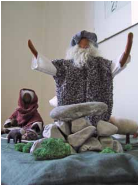
Abraham hat Gott einen Altar gebaut und betet

Der Theologe Rudolf Otto hat das Heilige treffend mit zwei Begriffen umschrieben. Es besteht aus dem mysterium fascinosum und dem mysterium tremendum , dem Geheimnis, das den Menschen unwiderstehlich anzieht und fasziniert und dem Geheimnis, das ihn ängstigt. Das Heilige kann in seiner Andersartigkeit durchaus verstören und gefährlich sein. Im Alten Testament ist es den Menschen deswegen verwehrt, Gott sehen zu können. Sein Anblick würde sie töten.