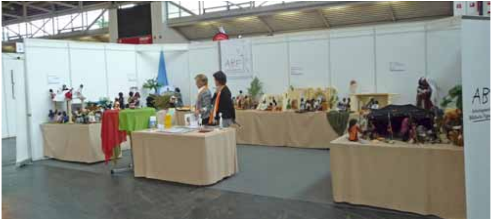
Der fertige Stand auf dem Ökumenischen Kirchentag

in die Bahn, also, kommen's rein, und wenn's eng wird; nehmen's halt die Schwiegermutter auf den Schoß". Ausgezeichnet vorbereitet waren auch wir von der ABF. Wie in den Jahren zuvor war es uns ein Anliegen, die Arbeit mit Biblischen Figuren weiter zu transportieren, sie vorzustellen und zu präsentieren. Biblische Figuren – ein geniales Medium zum Erzählen und Vertiefen der biblischen Botschaft!