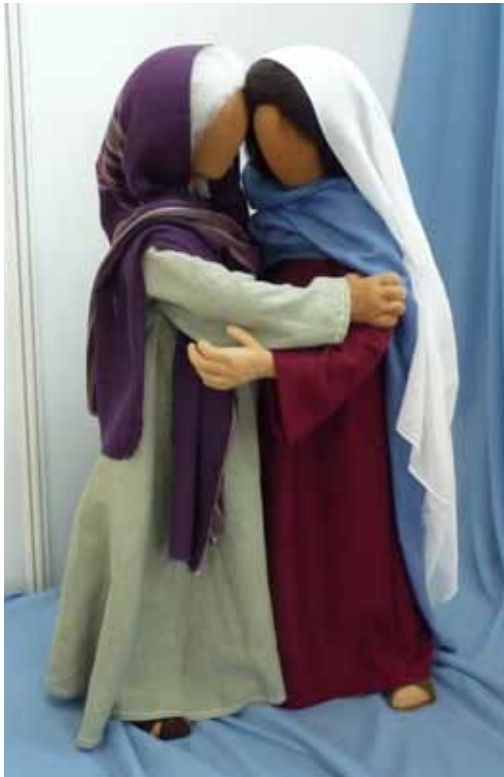
Zwei große 70er-Figuren